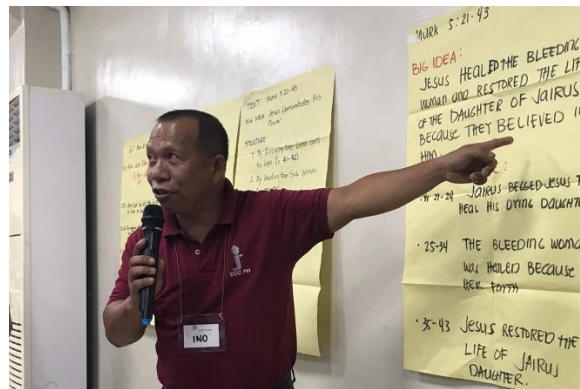
Voorganger in training met de Langham Preaching methode