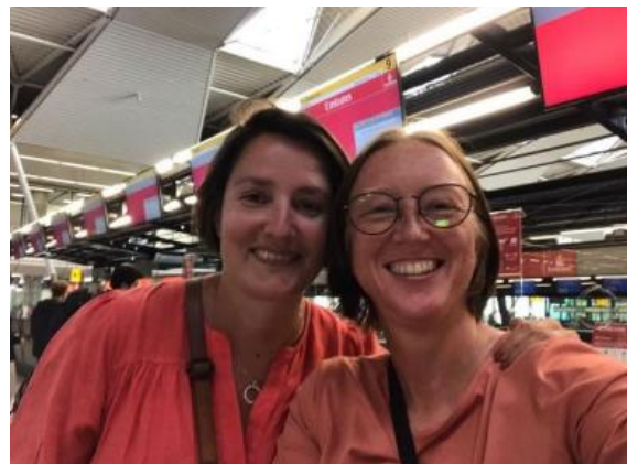
Afscheidnemen en uitzwaaien op Schiphol