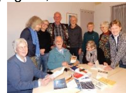
Een Avondje Theologie

'traditionele' bijbelkrijgen, activiteitenkringen etc.); kringen kunnen verdwijnen als het animo afneemt; en de bestaande kringen, commissies en werkgroepen kunnen ingepast worden in dit model. Het resultaat is idealiter een 'tailormade' pastoraat waar zoveel mogelijk gemeenteleden én anderen iets van hun gading vinden en elkaar ontmoeten.