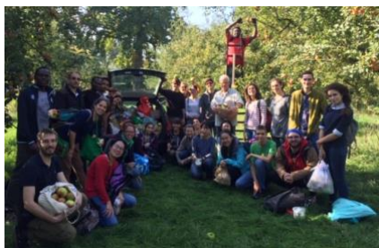
De studenten van het Studentenpastoraat plukken appels in de Betuwe

Zie ook: http://pknwageningen.nl (onder constructie).