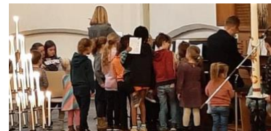
De kinderen bij de organist tijdens de kindervesper

Eén derde van onze gemeente is onder de 30 jaar, een zesde deel onder de 20 jaar. Twee derde is boven de 30 jaar. Jeugd is een speerpunt van de gemeente en we zijn heel blij met een levendige groep kinderen en jongeren.